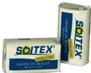
Réf:A136 1.00 € TTC Savon 100g