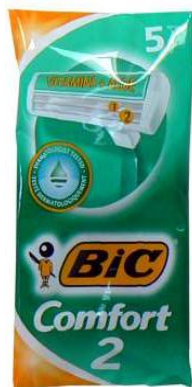
Réf:A102 7.00 € TTC 10 Rasoirs jetables 2 lames