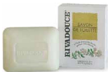
Réf:A460 4.10 € TTC Savon peau sensible senteur chèvrefeuille Enrichi en huile d'amande douce & en glycérine 150 gr