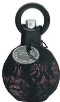
Réf:A417 4.50 € TTC Sexy Dentelle Eau de parfum femme 100 ml