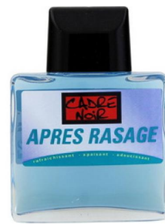
Réf:A115 5.00 € TTC Après rasage 125ml