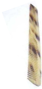
Réf:A104 2.00 € TTC Peigne