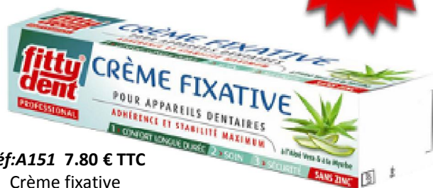
Réf:A151 7.80 € TTC Crème fixative de prothèse