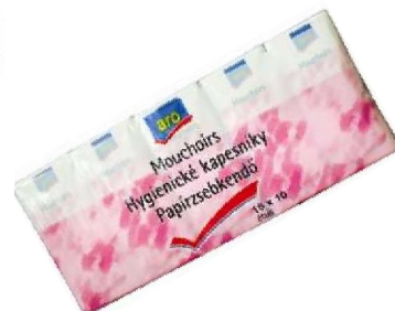
Réf:A154 3.10 € TTC Mouchoirs papiers 15 étuis de 10