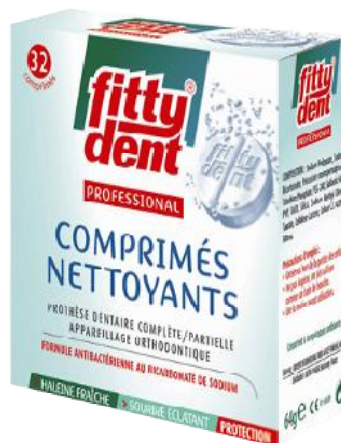
Réf:A152 7.00 € TTC Comprimés nettoyants de prothèse