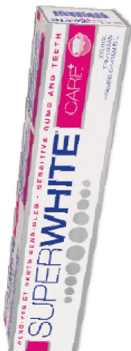
Réf:A118 7.00 € TTC Dentifrice 125ml grand modèle