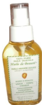
Réf:A336 2.70 € TTC Huile amande douce Visage corps cheveux 100 ml