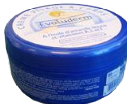
Réf:A329 3.60 € TTC Crème visage et corps Huile d'amande douce 250 ml