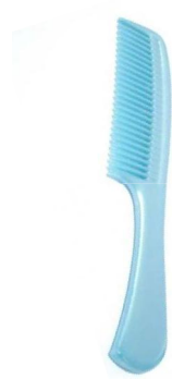
Réf:A103 2.00 € TTC Démêloir