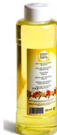
Réf:A068 3.50 € TTC Eau de Cologne 1 L Bouteille plastique