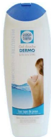
Réf:A099 3.10 € TTC Gel douche dermo 750 ml