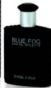
Réf:A250 4.50 € TTC Blue Fog Eau de toilette homme 100 ml