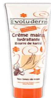
Réf:A330 3.20 € TTC Crème pour les mains karité 150 ml