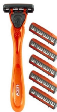
Réf:A304 11.00 € TTC Rasoir easy bic 3 lames