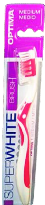
Réf:A128 2.50 € TTC Brosse à dent