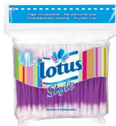
Réf:A173 3.10 € TTC 160 Coton-tiges