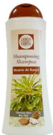
Réf:A109 3.10 € TTC Shampooing Beurre de karité 500 ml